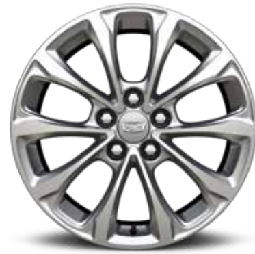
ألمنيوم مقاس 18 إنش بلمسة MANOOJIAN SILVER