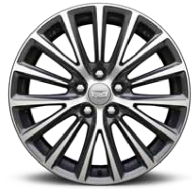
ألمنيوم مقاس 19 إنش بلمسة / MIDNIGHT SILVER 1