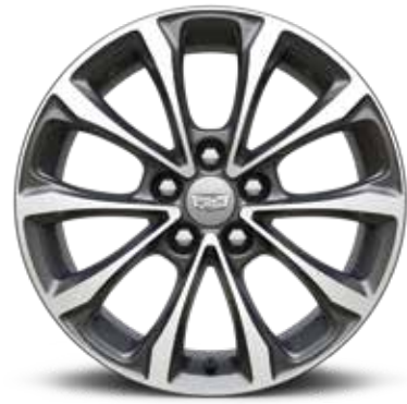
ألمنيوم مقاس 18 إنش بلمسة / ANDROID GLOSS 1