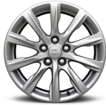
ألمنيوم مقاس 18 إنش بلمسة BRIGHT SILVER