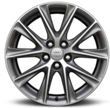
ألمنيوم مقاس 19 إنش بلمسة / ANDROID SATIN 1