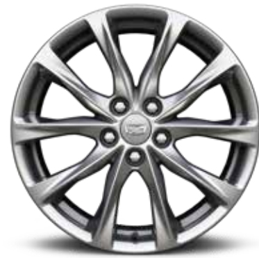
ألمنيوم مقاس 19 إنش بلمسة PEARL NICKEL