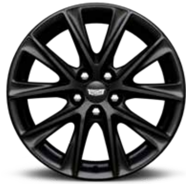
ألمنيوم مقاس 19 إنش بلمسة SATIN GRAPHITE 1